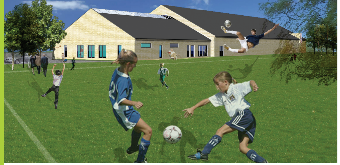
TILBYGNING SET FRA SYD

De to sportshaller og tilhørende fodboldbaner i Kolt-Hasselager savner omklædningsfaciliteter, klublokale og et motionscenter. En udvidelse af det eksisterende byggeri med disse faciliteter vil muliggøre en mere effektiv udnyttelse af de nyetablerede fodboldbaner, samt give plads til mødeaktiviteter i klubben.