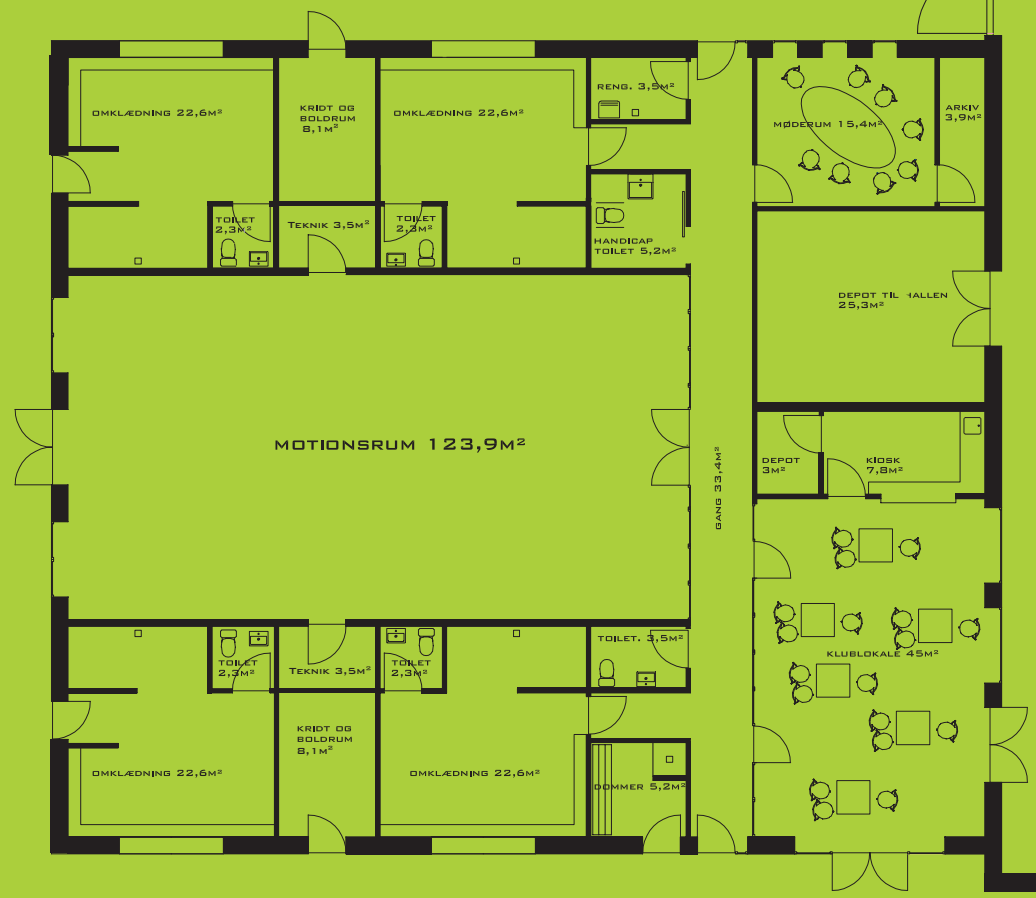
PLAN AF TILBYGNING